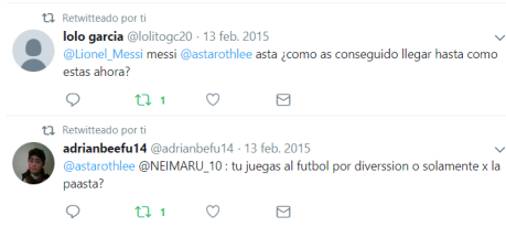
Fotografía 1. ¡Vamos hacer una entrevista!

A continuación, mostramos algunos ejemplos de las actividades realizadas por los estudiantes: