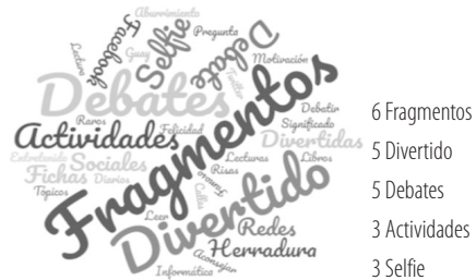
Imagen 1. Valoración de los estudiantes. Elaboración propia.

A finalizar esta experiencia, quisimos saber qué opinaban los estudiantes sobre estas actividades y dinámicas desarrolladas en el aula. Para ello, se les propuso que escribiesen palabras o ideas tanto positivas como negativas que les había sugerido.